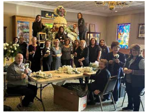
Holy Friday morning preparations for the Epitaphio