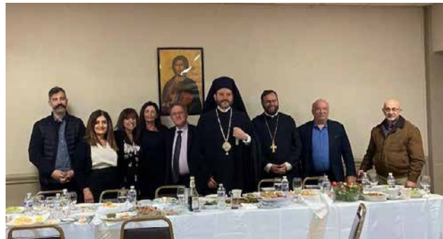
Greek Orthodox Metropolis of New Jersey His Eminence Metropolitan Apostolos of New Jersey Vesperal Divine Liturgy of St. Basil the Great Thursday, April 17, 2025