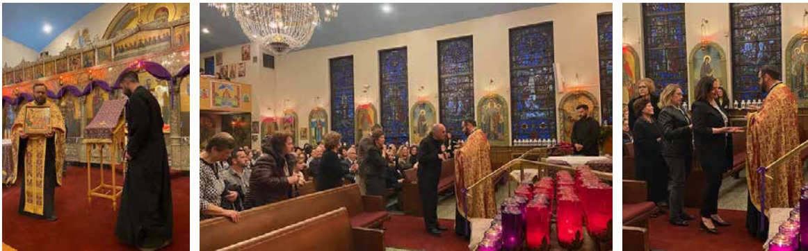
Holy Unction service Wednesday night