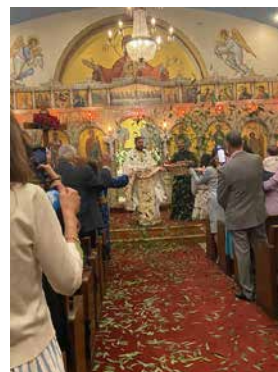
Holy Saturday morning