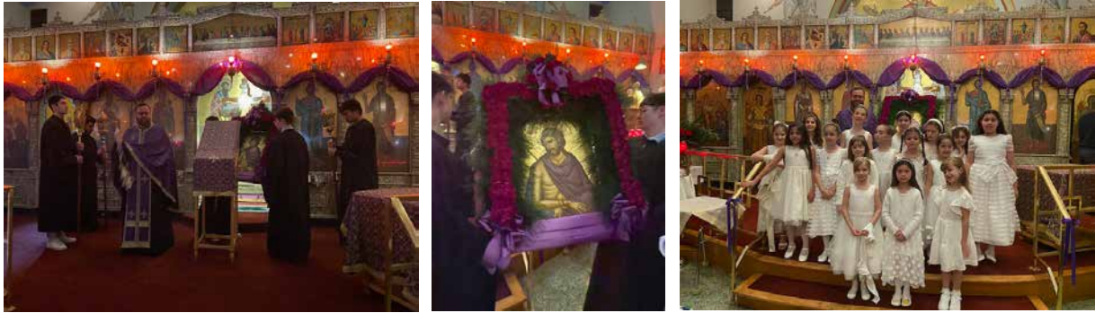
Nymphios service Sunday night with myrofores