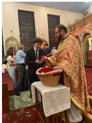
Holy Saturday night service