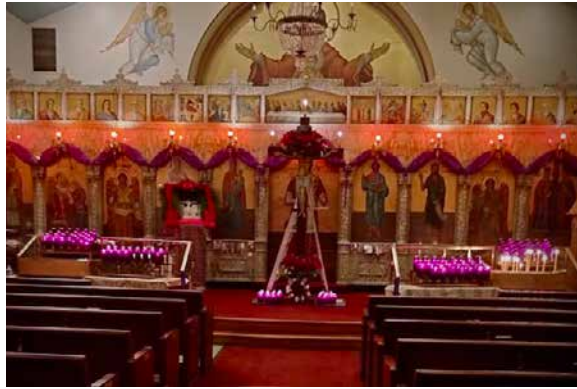
Holy Thursday evening