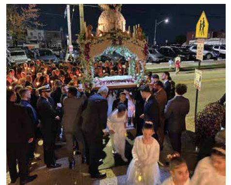
Holy Friday night