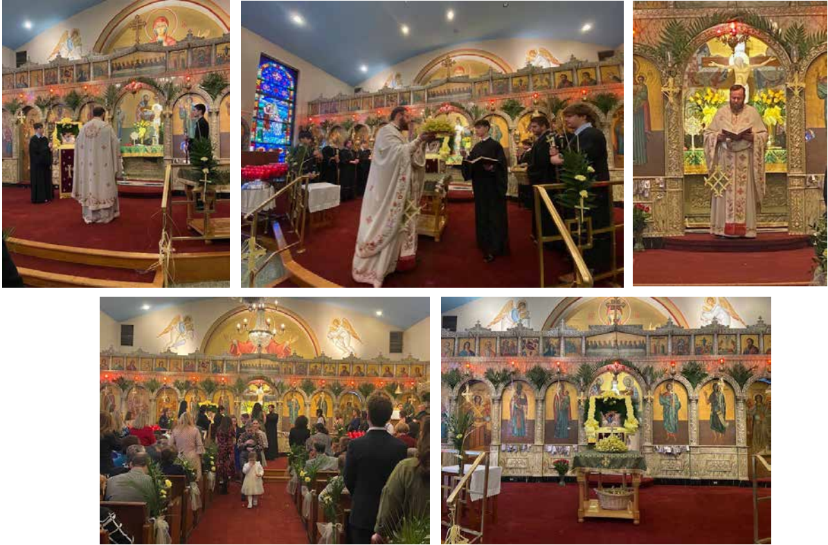
Palm Sunday service

To all of our Faithful parishioners and friends of St. Nicholas who joined us in the various services to worship as one church family throughout this Lenten Journey and to our arrival to celebrate the Great and Holy Pascha, we share with you this glorious message: