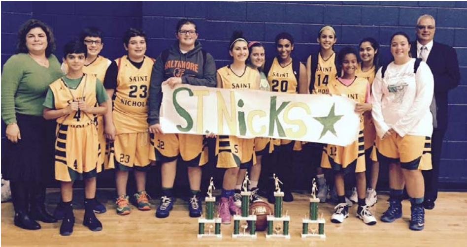
GOYA Basketball Boys and Girls Team Members

Pictures: GOYAnS having fun at the St. Sophia Greek Orthodox Cathedral of Washington, DC basketball tournament during the weekend of October 24th-25th.