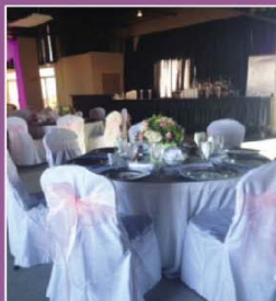
FIRST FLOOR HALL FOR UP TO 175 GUESTS

WEDDING RECEPTIONS • ANNIVERSARY CELEBRATIONS • BIRTHDAY PARTIES NEW YEAR'S EVE • COMPANY GATHERINGS • CLASS OR FAMILY REUNIONS RETIREMENT PARTIES • BUSINESS MEETINGS