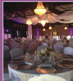
SECOND FLOOR BANQUET HALL FOR UP TO 400 GUESTS