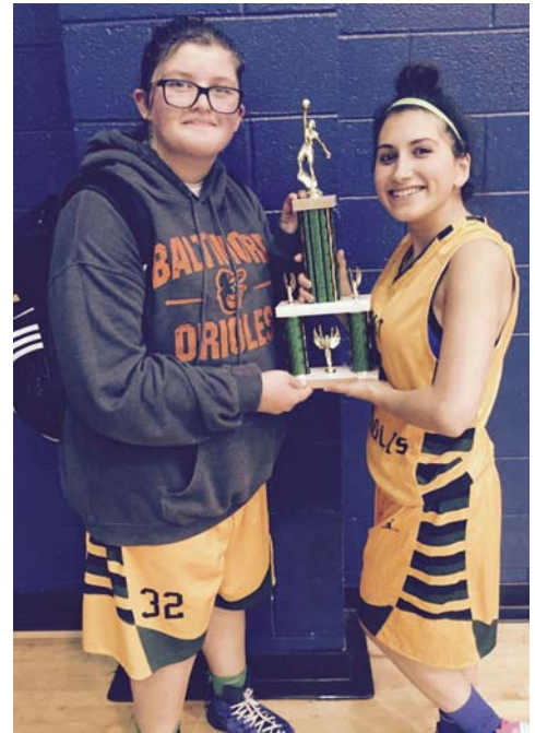
GOYA Girls A Team Champions