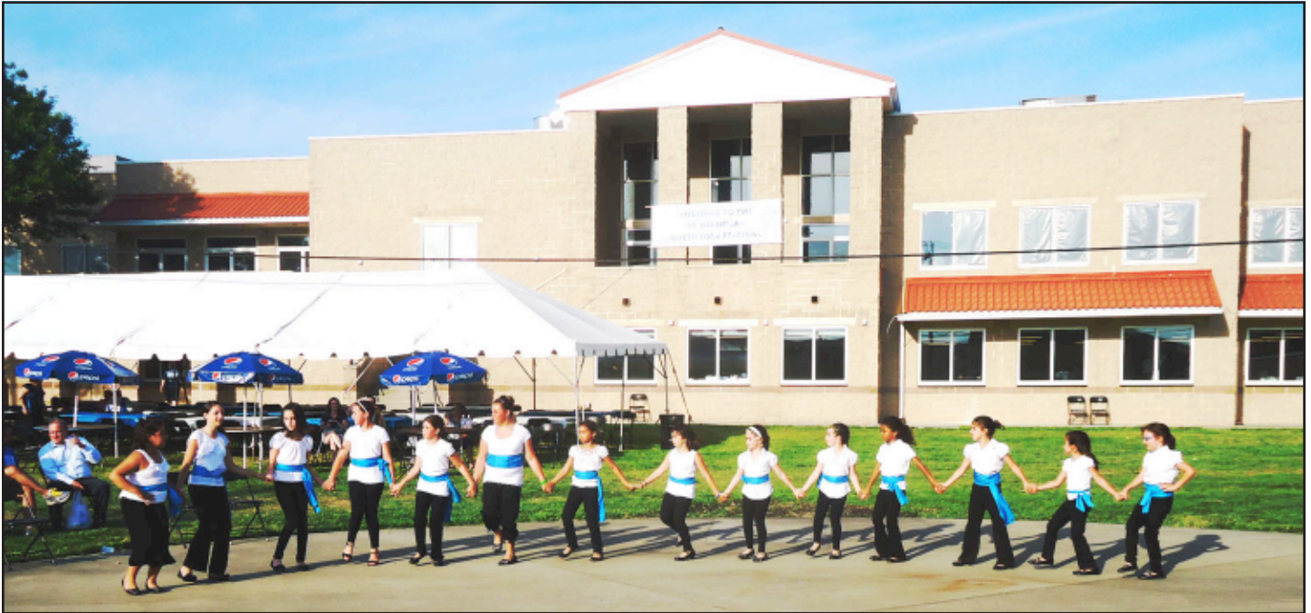
Greek School dancers bringing the Plateia grounds back to life.

On Tuesday, June 5th, the Saint Nicholas Greek Orthodox Church received the Use and Occupancy Permit for the lower level and 1st floor of the Plateia. Numerous of parishioners and Baltimoreans had the opportunity during our 4 day festival to tour and enjoy the new building. Also, the grounds surrounding the Plateia have been completed and many people enjoyed refreshments under the stars and moonlight of the summer night skies.