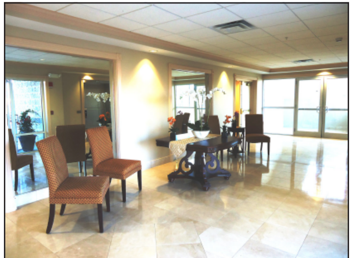
The Plateia's entrance lobby.

The completion of the lower level and 1st floor would not have been possible without the tireless support of St. Nicholas Parishioners and Patrons. The Plateia Committee members and Parish Council members have worked extremely hard to raise the funds necessary to complete the 1st phrase. However, the church now has a mortgage on the Plateia which we all must