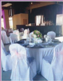
FIRST FLOOR HALL FOR UP TO 175 GUESTS

WEDDING RECEPTIONS • ANNIVERSARY CELEBRATIONS • BIRTHDAY PARTIES NEW YEAR'S EVE • COMPANY GATHERINGS • CLASS OR FAMILY REUNIONS RETIREMENT PARTIES • BUSINESS MEETINGS