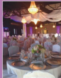
OUTDOOR VENUE WITH AMPHITHEATRE STAGE AND DANCE FLOOR FOR UP TO 1,500 GUESTS

701 QUAIL STREET BALTIMORE, MD 21224 • (410) 294-1253 • WWW.GREEKTOWNSQUARE.COM