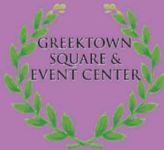
SECOND FLOOR BANQUET HALL FOR UP TO 400 GUESTS