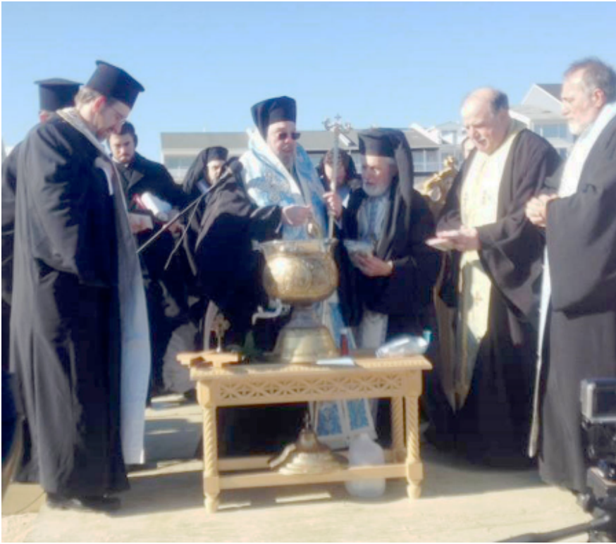
St. Nicholas Greek Orthodox Church's annual trip to St. George Greek Orthodox Church in Ocean City, Maryland took place on Saturday, January 10, 2015.